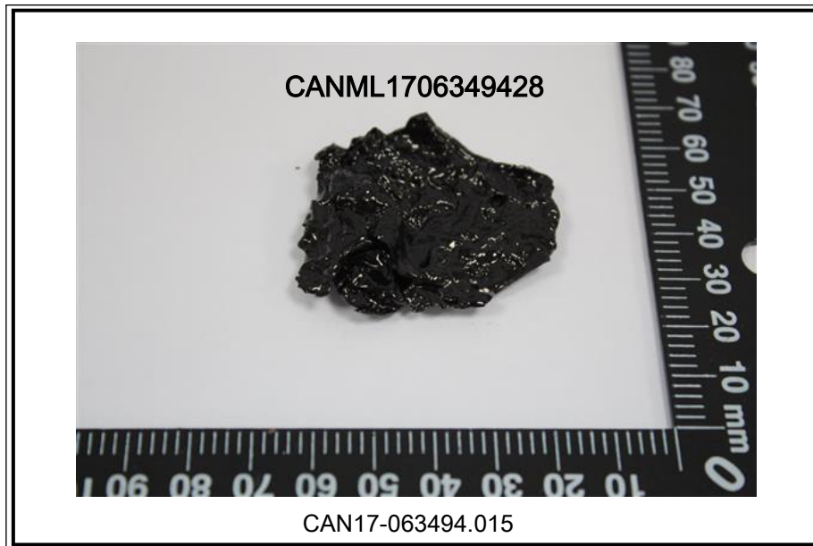
此照片仅限于随SGS正本报告使用